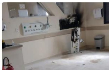
Vazamento em régua de oxigênio causa princípio de incêndio na UTI neonatal de hospital em Sorocaba

Por TV TEM e g1 Sorocaba e Jundiaí 30/05/2023 11h30 - Atualizado há um ano